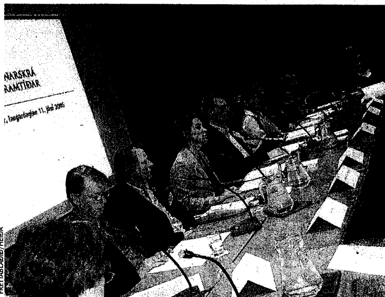
STJÓRNARSKRÁIN RÆDD Fulltrúar frjálsra félagasamtaka kynntu tillögur sínar fyrir stjórnarskrárnefnd og öðrum ráðstefnugestum í þremur málstofum.

Eins og þessi upptalning ber með sér voru tillögurnar af margvíslegasta tagi og snerta nær alla þætti stjórnarskrárinnar. Þó er ljóst að sumar þeirra eiga meiri möguleika á að verða að veruleika en aðrar. Út úr viðbrögðum fulltrúa stjórnarskrárnefndar mátti lesa að þótt ákvæðið hefði verið að einskorða endurskoðunina nú ekki við fyrsta, annan og fimmta kafla stjórnarskrárinnar, eins og upprunalegt erindisbréf hennar hljóðaði upp á, væri sennilegra að samstaða næðist um breytingar ef þær yrðu ekki of víðtækar. Verk-