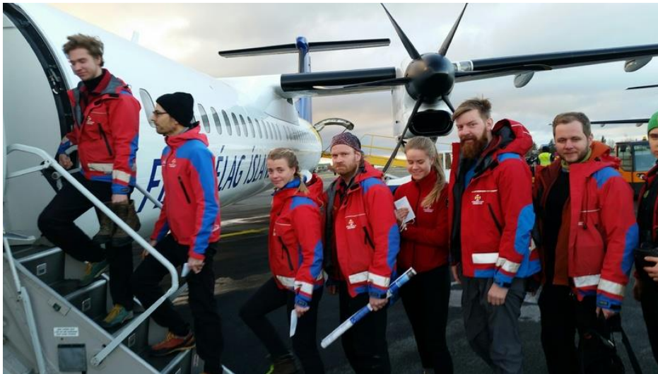
Mynd 3. Björgunarsveit Slysavarnafélagsins Landsbjargar á leið frá Reykjavík til Egilsstaða í nóvember 2016.

Eitt mikilvægasta öryggishlutverk Reykjavíkurlugvallar er að vera sá staður, þaðan sem flytja má mannskap og aðrar bjargar á vettvang í fjarlægustu byggðum landsins, þar sem náttúruhamfarir eða slys hafa orðið. Hér er átt við flutning björgunarsveita, hvers konar búnaðar, varnings og vista, sem koma þarf á vettvang á sem skemmstum tíma. Slíkir flutningar skipta ef til vill mestu máli í upphafi atburða en eru einnig mikilvægir sem stuðningur við framhald langvarandi aðgerða. Í mörgum tilvikum er engin önnur fær leið en að nota loftför til slíkra flutninga, þyrlur eða flugvélar. Sem dæmi má nefna leit að rjúpnaskyttu á Austurlandi í nóvember 2016, þegar 50 manna lið var sent frá Reykjavík til að taka þátt í leitinni 20 eins og sjá má að hluta á meðfylgjandi mynd Morgunblaðsins.