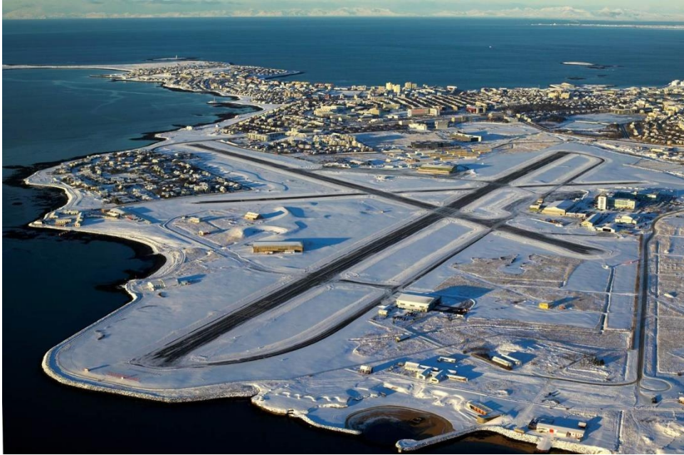
Mynd 1. Reykjavíkurlugvöllur eftir endurbyggingu flugbrauta árið 2001.

Í þessu verkefni er gengið út frá því að tveir kostir séu í stöðunni, þ.e. að staða Reykjavíkurlugvallar verði óbreytt eða að komið verði upp nýjum flugvelli á höfuðborgarsvæðinu eða nágrenni. Sá flugvöllur mundi að lágmarki taka við því heildarhlutverki, sem Reykjavíkurlugvöllur gegnir nú. Samkvæmt skýrslu Rögnunefndar liggur fyrir ótvíræð niðurstaða um að besta staðinn fyrir slíkan flugvöll sé líklega að finna í Hvassahrauni vestan Hafnarfjarðar. Því verður þessi kostur einnig skoðaður út frá almennu öryggissjónarmiði. Það er skoðun höfundar að allir aðrir kostir, sem fjallað er um í heimildum 2 og 3 séu í raun út úr myndinni vegna verndunar viðkvæmrar náttúru, umróts á byggðum svæðum eða vegna þess að veðurfar og lega þeirra eru óhagstæð. Þó verður að hafa í huga að langt er frá að sýnt hafi verið fram á með óyggjandi hætti að Hvassahraun sé viðunandi flugvallarstæði. Í skýrslu Rögnunefndar kemur skýrt fram að tillagan er byggð á frummati á fimm lykilþáttum varðandi nýjan flugvöll, þ.e. veðurfari, landrými, flugtækni, umhverfismálum og stofnkostnaði og nauðsynlegt sé að fullkanna þessa þætti.