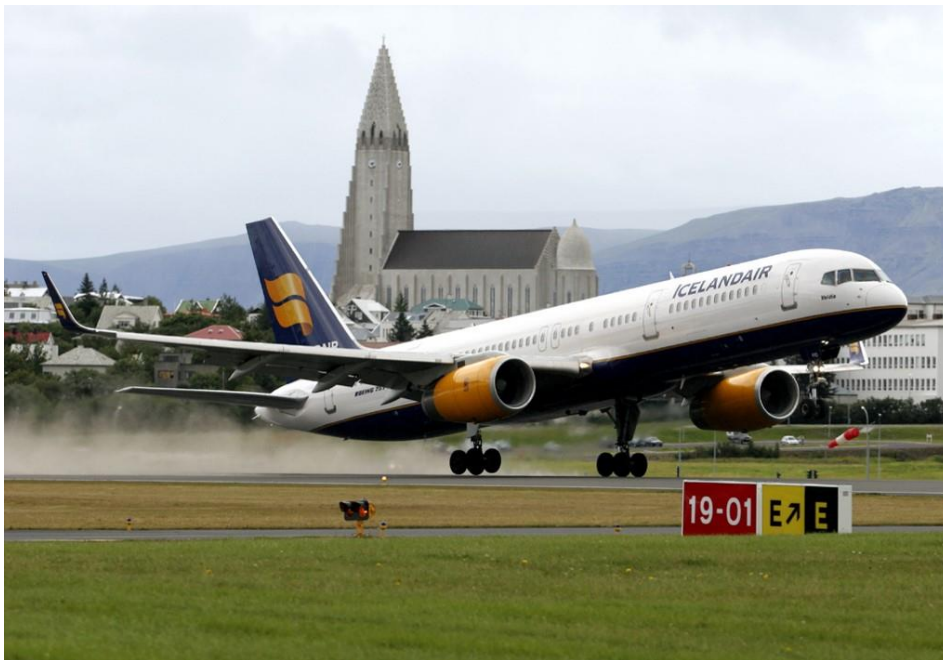
Mynd 4. Boeing 757-200 Icelandair á Reykjavíkflugvelli.

Staðsetning Reykjavíkflugvallar í Vatnsmýrinni er því afar góð til að veita þann stuðning sem þörf er á fyrir loftflutninga vegna hvers konar almannavarnaatburða. Aðgengi að öllum birgðum og björgum er á næsta leiti og í flestum tilvikum innan við stundarfjórðungs akstur frá flugvöllinum. Flugvöllurinn getur þjónað stórum flugvélum allt upp í Boeing 757-200, Lockheed Hercules C-130 og Boeing C-17, svo dæmi séu nefnd. Þessar flugvélar geta flutt 20-70 tonn af varningi eða allt að 170 farþega á stuttum flugleiðum innanlands. Þá geta þessar flugvélar og margar fleiri tegundir flogið til og frá nágrannalöndum austan hafs og vestan þótt í sumum tilvikum gæti verið um einhverjar þyngdartakmarkanir að ræða vegna lengda flugbrauta. Umtalsverð aðstaða er á flugvöllinum til að taka við fólki ef flugskýli eru nýtt í þessu skyni og sama gildir um vörur og annan flutning.