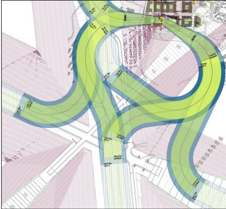
Mynd 2. Aðflug að þyrlupalli á nýja Landspítalanum 16 .

Þar sem sami háttur yrði að öllum líkindum á vali lendarstaðar og áður er lýst mundu langflestar ferðirnar enda með landingu á flugvellinum en ekki þyrlupallinum. Gert er ráð fyrir að góð aðstaða sé á flugvellinum til þess að flytja sjúklinginn yfir í sjúkrabíl eins og verið hefur eða mynduð bein leið milli flugvallarins og sjúkrahússins. Augljóst er að verði Reykjavíkflugvelli lokað árið 2024 verður erfitt eða ófært að nota þyrlur til að fljúga með sjúklinga inn á þyrlupall sjúkrahússins eins og gert hefur verið um langt árabil nema komið verði upp sérstakri aðstöðu til aðflugs sem krefst nýrrar leiðsögutækni og umtalsverðs landsrýmis. Hér er hins vegar um að ræða grunnkröfu sem þarf að uppfylla á líkan hátt og gert hefur verið hér á landi og í nágrannalöndunum 17 .