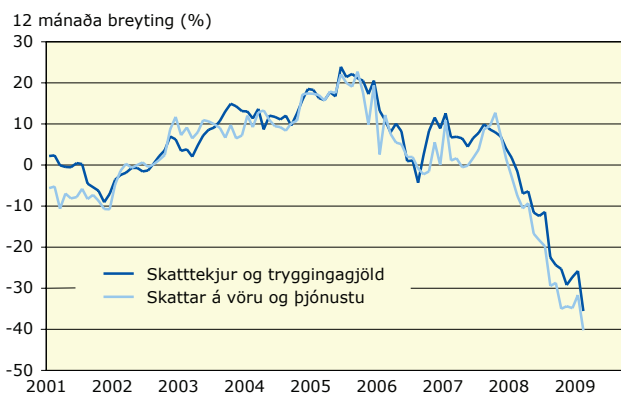
Raunbreyting skatttekna og tryggingagjalda og skatta á vöru og þjónustu (m.v. VNV án húsnæðis og 4 mánn. hlaupandi meðaltal)

Lánsfjárfjöfnuður ríkissjóðs er neikvæður um 32,9 milljarða króna í maí á móti 9,5 ma.kr. jákvæðum lánsfjárfjöfnuði á sama tíma í fyrra. Hreinn lánsfjárfjöfnuður var neikvæður um 31,6 milljarða króna og lækkar um 59,1 milljarða milli ára sem skýrist með lækkun á handbæru fé frá rekstri. Frá áramótum hefur ríkissjóður selt ríkisbréf fyrir um 88,4 milljarða og lækkað stofn ríkisvixla um 13,6 milljarða. Þá tók ríkissjóður lán frá Færeypjum í mars að fjárhæð 300 milljónir danskra króna, jafnvirði 6,4 milljarða íslenskra króna. Á móti námu afborganir 1,3 milljarði króna sem skiptist jafnt á milli spariskírteina og annarra lána ríkissjóðs.